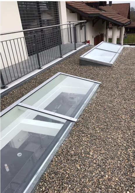
Dachoblicht mit 12mm VSG glas Ohne Folie

Die Dachoblichter können Ausschliesslich bei Kiesklebedach, oder Dachbegrünung montiert werden. Bei Profilblechdächern müssen Lichtdurchlässige dachelemente montiert werden.