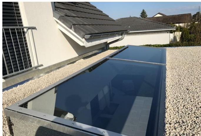
Dachoblicht mit 12mm VSG glas mit Folie